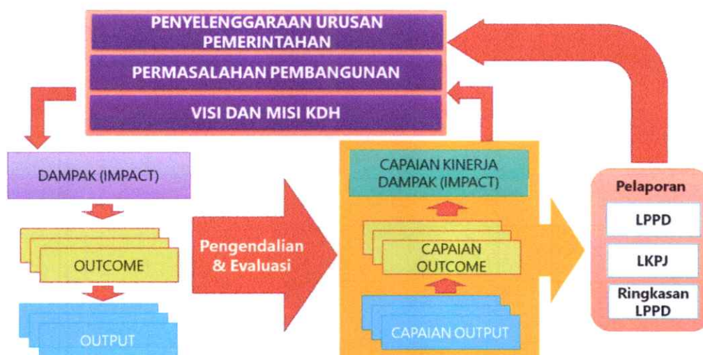
Gambar 4.1. Indikator Kinerja sebagai Instrumen Keberhasilan Pembangunan dan Good Governance

Indikator kinerja merupakan gambaran tingkat pencapaian suatu program, kegiatan dan sasaran yang telah ditetapkan. Indikator kinerja memberikan penjelasan baik secara kuantitatif maupun secara kualitatif mengenai apa yang diukur untuk menentukan apakah tujuan sudah tercapai. Selain itu, indikator kinerja merupakan cerminan sebuah fungsi dari keluaran kegiatan pada jangka menengah (efek langsung) dimana pengukuran indikator “dampak” lebih utama daripada “hasil”, dan “hasil” itu sendiri merupakan agregasi seluruh “keluaran” dari keberhasilan kegiatan yang ada didalamnya. Indikator kinerja akan dapat dijadikan sebagai media perantara untuk memberi gambaran tentang keberhasilan pembangunan dan Good Governance yang diharapkan di masa mendatang, sebagaimana yang ditunjukkan oleh gambar berikut :